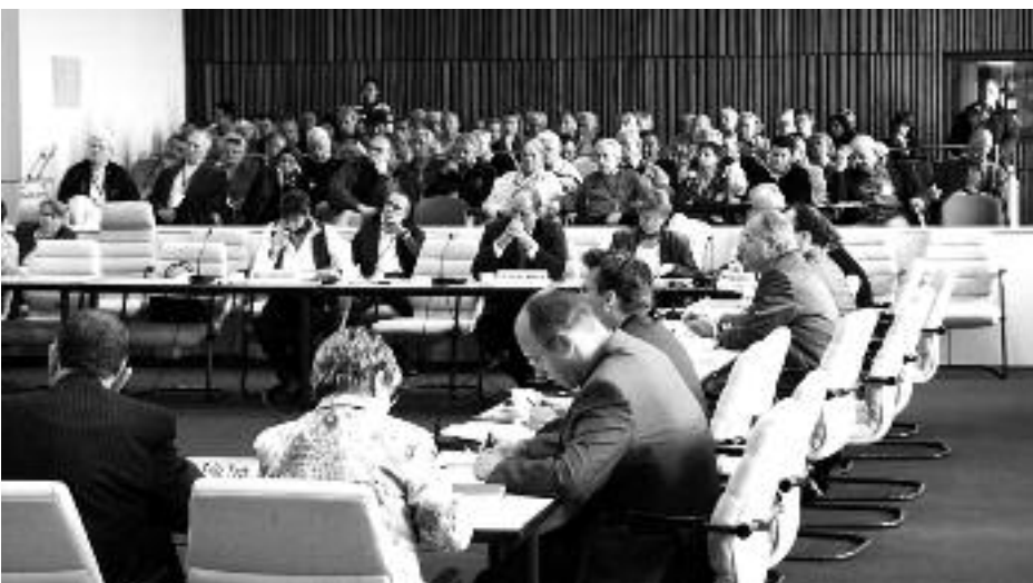
14 Zahlreiche Bürgerinnen und Bürger verfolgten auf der Besuchertribüne im Plenarsaal die öffentliche Anhörung zur „Volksinitiative für ein weltoffenes, friedliches und tolerantes Mecklenburg-Vorpommern“.

Schwerpunkt der Beratungen der Arbeitsgruppe in den kommenden Monaten wird sein, insbesondere die Potenziale erneuerbarer Energien der südlichen Ostseeanrainerstaaten auszuloten. Im Vordergrund stehen dabei Fragen der grenzüberschreitenden Zusammenarbeit und des Klimaschutzes.