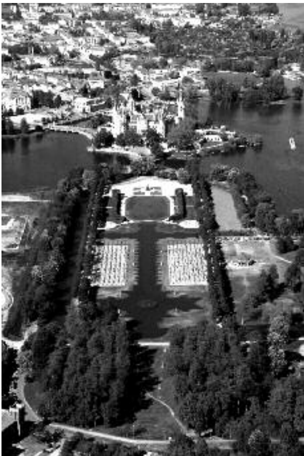
Der Landtag räumt dem Schweriner Schloss mit den historischen Parkanlagen und dem klassizistischen Bauensemble Alter Garten gute Chancen ein, als UNESCO-Welterbe anerkannt zu werden.

Zunächst soll die Landesregierung dem Beschluss zufolge versuchen, das Schloss auf die deutsche Liste der Anwärter auf Anerkennung als UNESCO-Weltkulturerbe zu bringen. Die Chancen stehen nach Einschätzung von Landtagspräsidentin Sylvia Bretschneider gut, da Gebäude und Gar-