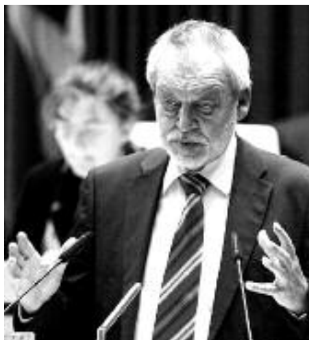
Verkehrsminister Otto Ebnet