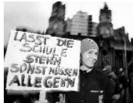
Das Volksbegehren gegen das Schulgesetz von Mecklenburg-Vorpommern, das der Landeselternrat 2006 initiiert hatte, wurde von rund 73.000 Bürgerinnen und Bürgern unterstützt. Dies reichte nicht, denn die Verfassung des Landes M-V forderte (damals) 140.000 Unterstützungsunterschriften. (Aktuell sind 120.000 Unterschriften erforderlich.)

verschiedene plebiszitäre Verfahren: Initiativen aus dem Volk, Volksbegehren und Volksentscheid.