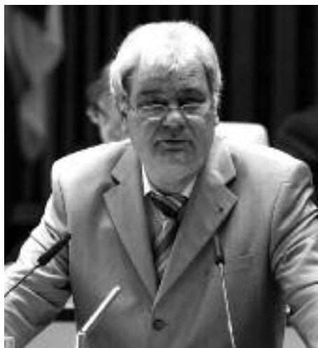
Prof. Dr. Wolfgang Methling (DIE LINKE)

Der Nothafen Darßer Ort liegt in der Kernzone des Nationalparks Vorpommersche Boddenlandschaft rund vier Kilometer vom Ostseebad Prerow entfernt. Er wurde 1962 als Schnellboothafen für die DDR-Marine gebaut. Nach der Wende blieb er für Sportboote erhalten. In die Zufahrt wird Sand gespült, der regelmäßig abgetragen werden muss. Ohne die ständige Ausbaggerung von rund 100 Metern Fahrrinne würde die Bucht heute wohl nicht mehr existieren. Betreiber des landeseigenen Hafens ist seit 1993 die Umweltstiftung WWF. Die letzte Ausbaggerung 2005 kostete laut WWF 240.000 Euro. Es stehe in der Nationalparkverordnung, dass der Nothafen nur eine Übergangslösung sei und stillgelegt werden solle. Der WWF würde Gesprächen über eine nochmalige Ausbaggerung nur zustimmen, wenn für den in Prerow geplanten Hafen eine rechtsgültige Baugenehmigung vorgelegt würde. Tourismusmanager fordern dagegen den Erhalt des Nothafens, da für Segler die 60 Seemeilen weite Strecke von Warnemünde nach Barhöft bei Stralsund ohne Hafen zu lang sei.