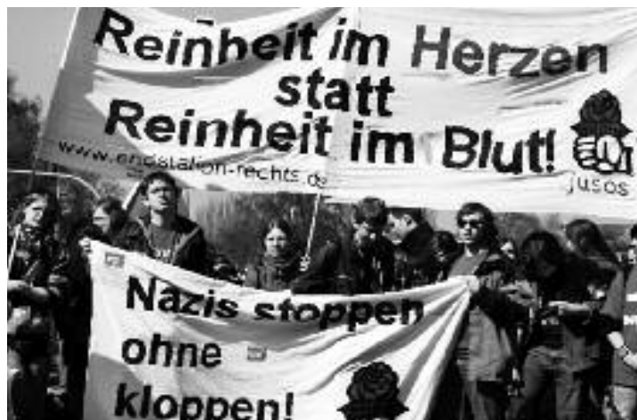
Jugendliche demonstrieren gegen einen NPD-Aufmarsch.

ab. Das wäre dann die offizielle Harmlosigkeitsbescheinigung. Bei dem, was Sie sagen, müssen Sie schon Widersprüche vermeiden“, sagte er in Richtung der Koalitionsfraktionen.