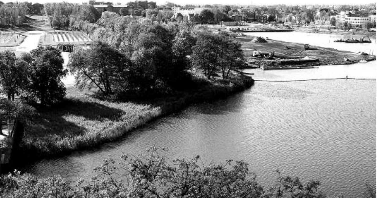
Im Burgsee am Schweriner Schloss entsteht die „Schwimmende Wiese“ – das Kernstück im „Garten des 21. Jahrhunderts“ zur Bundesgartenschau 2009 in Schwerin.

Areal soll Prunkstück zur Bundesgartenschau 2009 werden