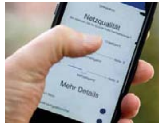
Vielereorts ist in M-V die Netzqualität schlecht.

der zweiten Generation. Und auch im 4G-Netz setzten die Anbieter in puncto Abdeckung auf Haushalte statt auf Fläche. Aus betriebswirtschaftlicher Sicht möge das nachvollziehbar sein. „Wenn wir als Politik im Mobilfunk aber den Aspekt der Daseinsvorsorge sehen, dann ist dieser Zustand auf gar keinen Fall zu akzeptieren.“ Abhilfe könnte zum Beispiel ein nationales oder regionales Roaming schaffen. Ein alleiniger „Fingerzeig nach Berlin“ reiche jedoch nicht. Auch das