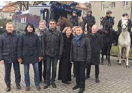
Bei der Polizei in Hamburg informierte sich der Innen- und Europaausschuss über Kosten und Wert einer Reiterstaffel.

■ Über den Einsatzwert, die Voraussetzungen und notwendigen Kosten einer Reiterstaffel hat sich am 17. Januar der Innen- und Europaausschuss bei der Polizei in Hamburg informiert. Durch aktive Teilnahme an einer Übung erlebten die Ausschussmitglieder hautnah die Interaktion zwischen Bereitschaftspolizei und Reiterstaffel. Simuliert wurden typische Einsatzszenarien.