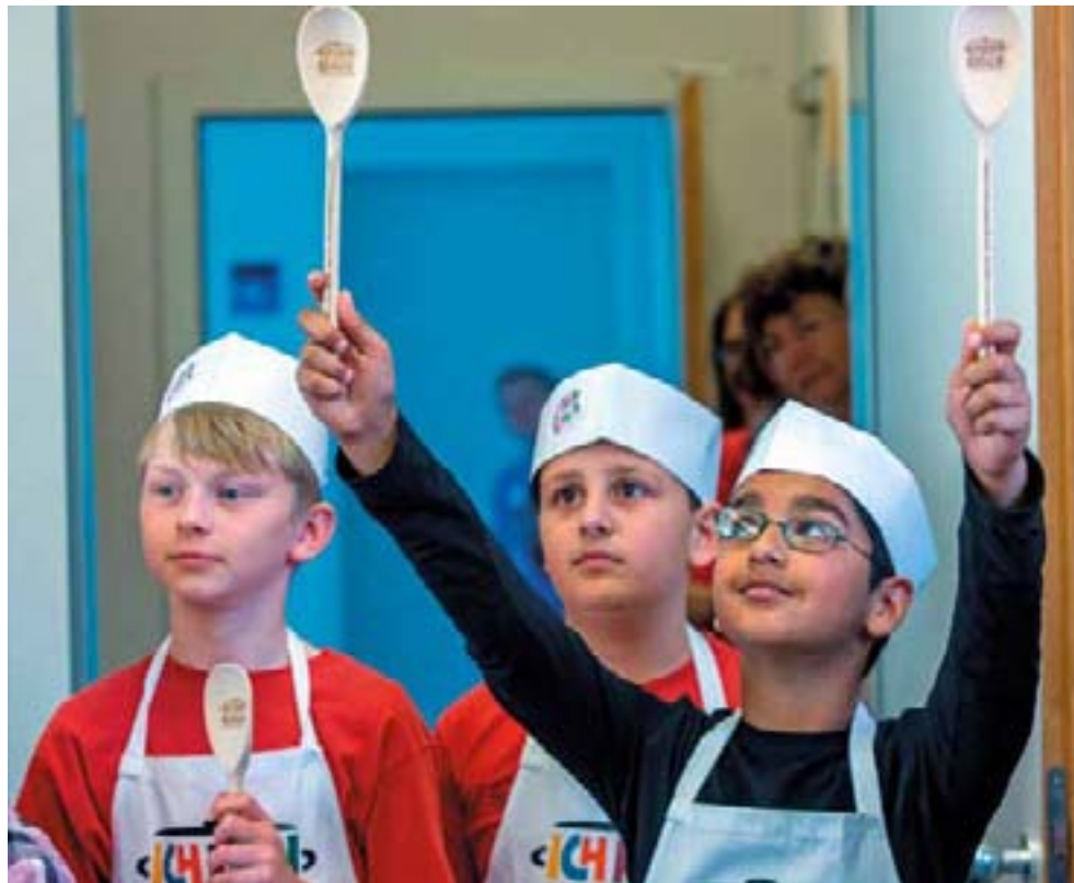
Spaß beim Kochen ist das beste Rezept für eine gesunde Ernährung.