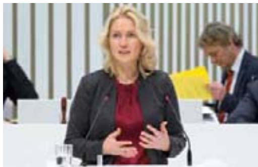
Ministerpräsidentin Manuela Schwesig