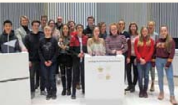
Vorab-Stippvisite im Plenarsaal für die Teilnehmenden des Landesfinals „Jugend debattiert“, das am 26. März 2019 in Schwerin stattfinden wird.

wenn ich glückliche Menschen sehe, die so wie ich ganz besonders mit ihren Kindern und Enkelkindern voller Freude und zwanglos vom Alltag befreit die Zeit verbringen können.