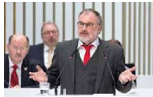
Christoph Grimm (AfD)